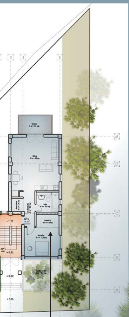
Ap.2 (Sct = 78,4 mp)

Finisajele exterioare și interioare vor fi de cea mai bună calitate.