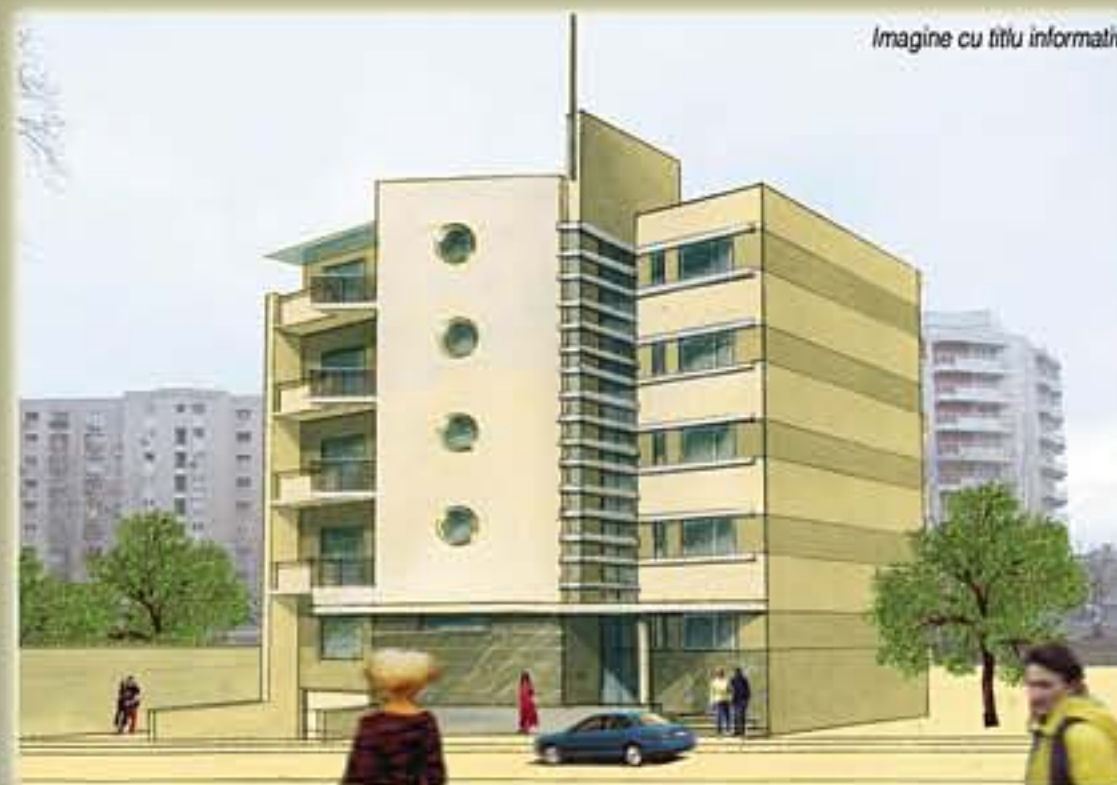
Imagine cu titlu informativ